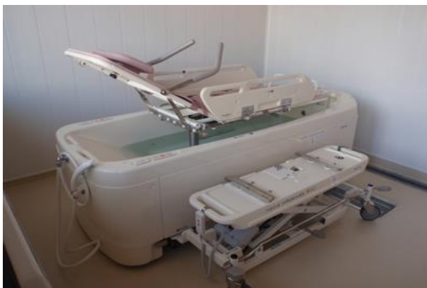
<障がいのある方のための入浴設備整備>