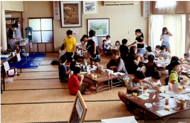
<こども食堂の活動支援>