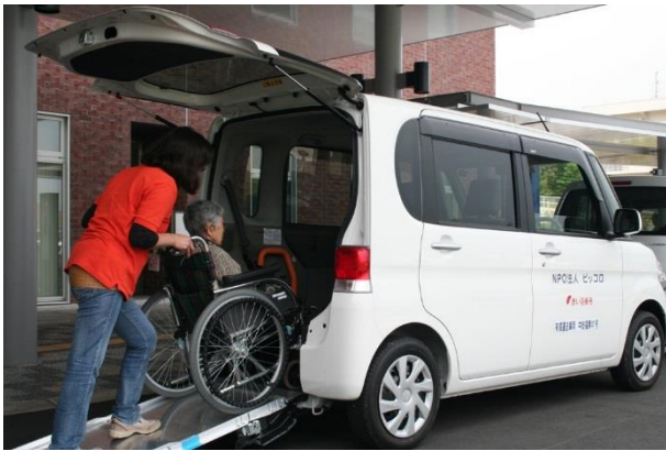
<身体が不自由な方の送迎用車両の整備>