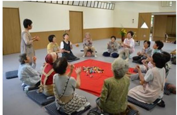
<高齢者の閉じこもり・介護予防>