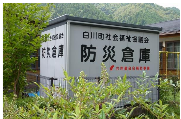
<災害時の支援物資等保管倉庫の整備>